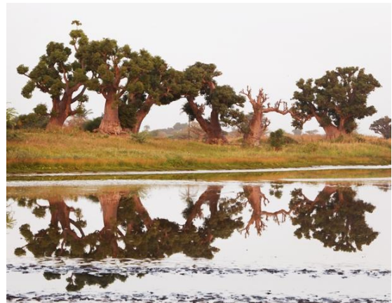
Sur la piste entre Samba Dia et Djiferre.