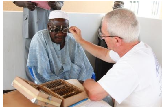
Simal. Séance d'examen dans le dispensaire.