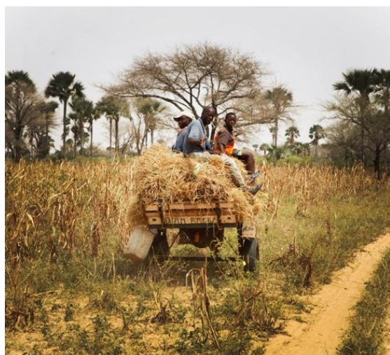
Sur la piste entre Djilor et N'Dangane.