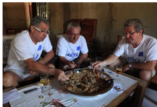
Yayème. Le couscous sénégalais.