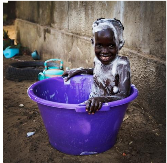
Soudiane. C'est l'heure du bain !