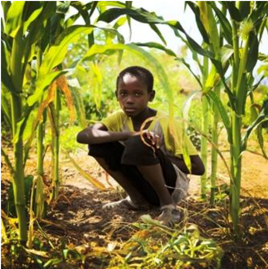
Soudiane. Dans le jardin du chef de village.