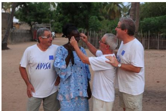
Djilas. Lorsqu'une jolie femme se présente, il y a des volontaires !!!