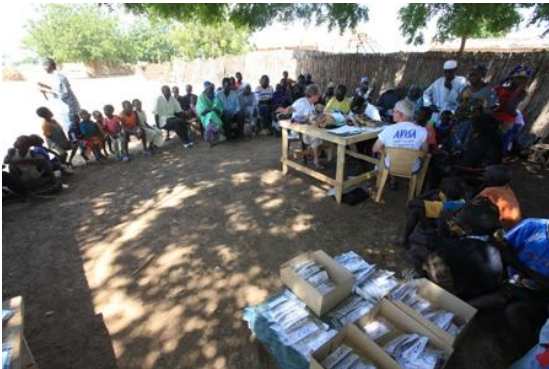
Keur Martin. A l'ombre des nims au bord de la route.

Nous rentrons tardivement et dînons à N'Dangane