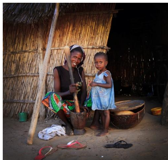
Photo de famille dans un village.