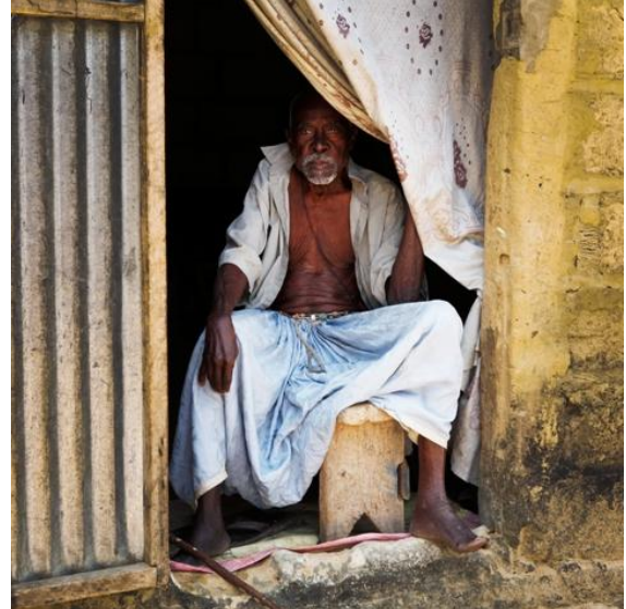
Deux vieux sénégalais photographiés par Jérôme.