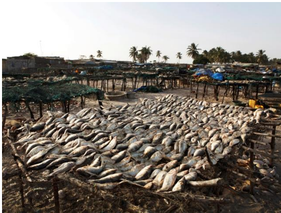
Djiferre. Les sècheres de poissons.

Nous continuons jusqu'à Djiferre pour que notre photographe puisse prendre quelques photos car l'endroit est très typique. La piste est littéralement défoncée et nous mettons encore une heure pour parcourir les 15km restants. Mais le site très particulier de cette étroite langue de terre entre le fleuve et l'océan vaut le voyage.